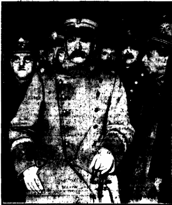
Na dworcu Wileńskim w Warszawie