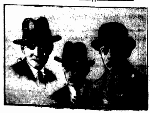
Jaki kapelusz kupił na jesień? Eleganci warszawscy stoją wobec pytania: jaki kapelusz kupić na jesień. Odpowiedź — na zdjęciu.