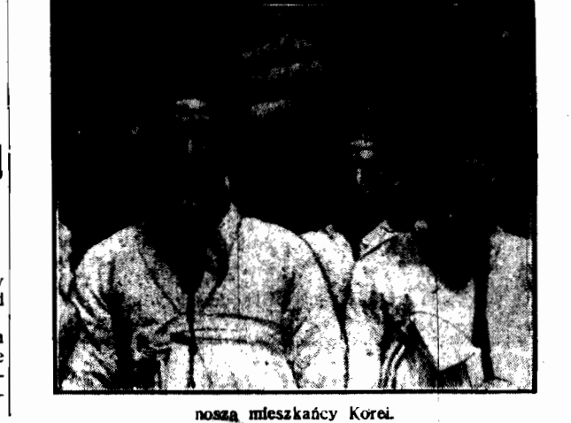
nasza mieszkanka Korei.